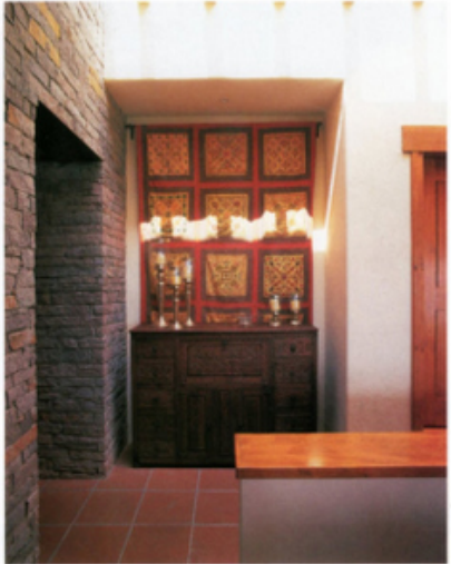
IZQUIERDA: Otra vista de la sala comedor. ARRIBA: El remate del pasillo es una muestra espectacular del arte que se impregnó en las piedras de brasa talladas en rectángulos, que constituyen una pared llena de textura, ofreciendo un impresionante contraste visual. ABAJO: La terraza es una de las áreas más bellas. Su acceso puede ser por la sala o por el comedor, sólo basta abrir los ventanales y disfrutar del jardín rematado por plantas de agave.